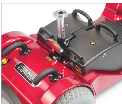
Grazie alle sue grandi batterie Sterling ®2 ti può portare lontano!

Adesso lo Sapphire ®2 può essere trasportato nell'auto. Fortunatamente, essendo uno degli scooter più leggeri della sua categoria, questo non è più un problema alle doppie maniglie sulle batterie e sulla parte posteriore del telaio. Permettono di sollevare e maneggiare le parti in modo comodo e sicuro.