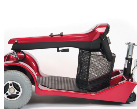
Il manubrio può essere piegato completamente per il trasporto