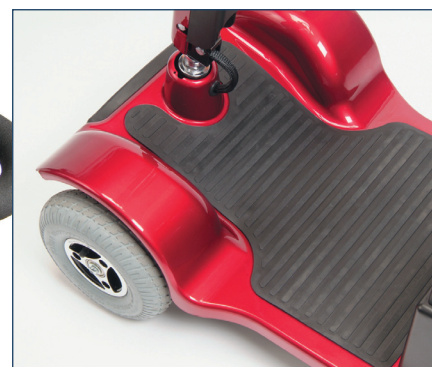
Ampio spazio per le gambe