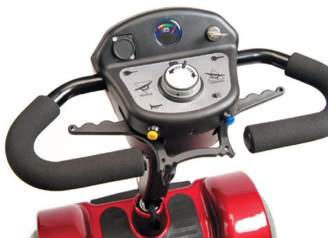
Comandi accessibili e facili da usare

Ora sei pronto! Stendi le gambe e approfitta del comfort che ti offre Sapphire ®2 : hai lo stesso spazio per le gambe che avresti con uno scooter a tre ruote con la stabilità delle quattro ruote, manubrio regolabile, maniglie avvolgenti, comandi accessibili e facili da usare.